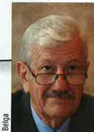
PHILIPPE MOUREAUX S'ÉTAIT OPPOSÉ AVEC VIRULENCE le jour où la Sûreté de l'Etat s'était impliquée dans les élections de l'Exécutif des Musulmans de Belgique.

cutif des Musulmans de Belgique (EMB) créé en 1996. Une institution qui n'a jamais vraiment fonctionné et qui a connu quelques ennuis judiciaires. Au milieu des années 2000, un dossier pénal le vise pour détournements de fonds, faux et usage. Mais le par-