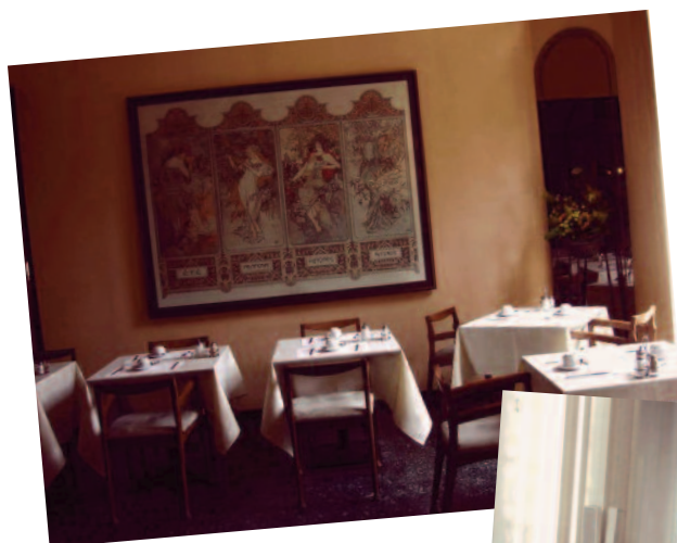
HOTEL COLUMBUS 'Operatief geschikt' volgens de Stasi.