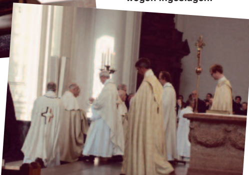
ABDIJ VAN AVERBODE 'Met het klooster zijn nieuwe en veelbelovende wegen ingeslagen.'