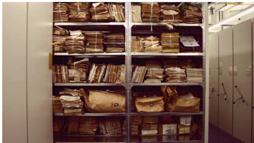
HET STASI-ARCHIEF Het rapport over student Strobel was 415 pagina's dik.

Strobel vertelt over de verveling tijdens de vele nutteloze momenten in de legerbasis. Blij dat het achter de rug is.